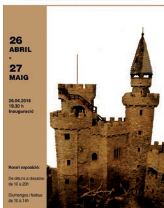
L'arquitecte de Lil·liput Un recorregut pel món en miniatura de Ramon Autet

El castell és, en aquesta exposició, la porta d'entrada a un món en miniatura on els visitants podran imaginar que es converteixen, per una estona, en habitants diminuts d'una població imaginària. Es podran veure els detalls d'una desena d'obres com un pessebre, masies, cases típiques de Galícia o del País Basc, un pont i, les eines i detalls que l'artista fabrica i utilitza per completar les obres. Aquesta és només una part de les 200 obres realitzades per Ramon Autet, que als seus 55 anys segueix treballant per augmentar dia a dia el seu "Lil·liput particular". El món de la miniatura és un ofici artesà poc conegut però molt valuós. La rigorositat en la reproducció, la cerca de la perfecció, la qualitat i excel·lència del miniaturista fan que aquestes petites obres es converteixin en un referent de l'artesanía arreu. L'exposició es podrà visitar de dilluns a divendres de 10 del matí a 8 del vespre, i els diumenges i festius de 10 a 2 del migdia.