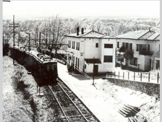
Estació de tren de Balenyà (Baixador)